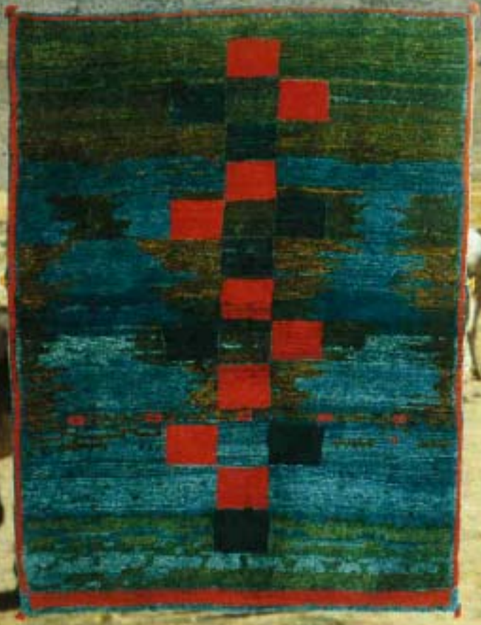
12010 graffiti, 214x162 cm.