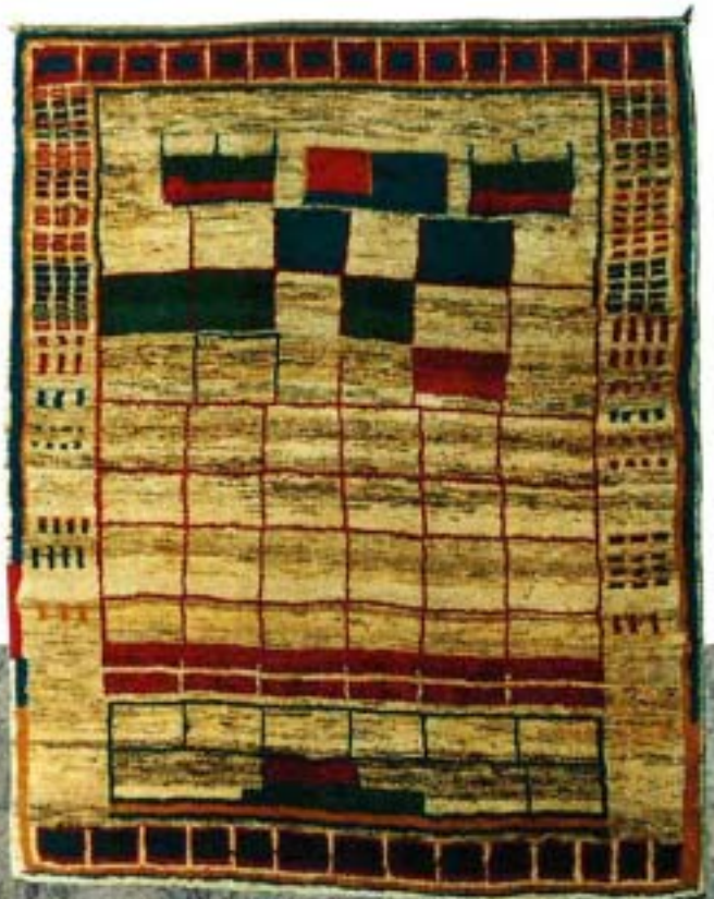
11761 grafiti ® ; 193x156 cm.