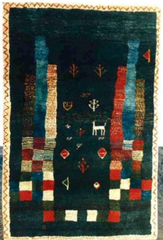
12030 graffiti - 173 x 128 cm.

N 30° 27.828' E 52° 31.174' 2230 m au dessus du niveau de la mer. Des chiffres froids, lus sur mon GPS Garmin 75, sur un haut plateau du sud de l'Iran qui me rappelle l'histoire intéressante d'un long développement.