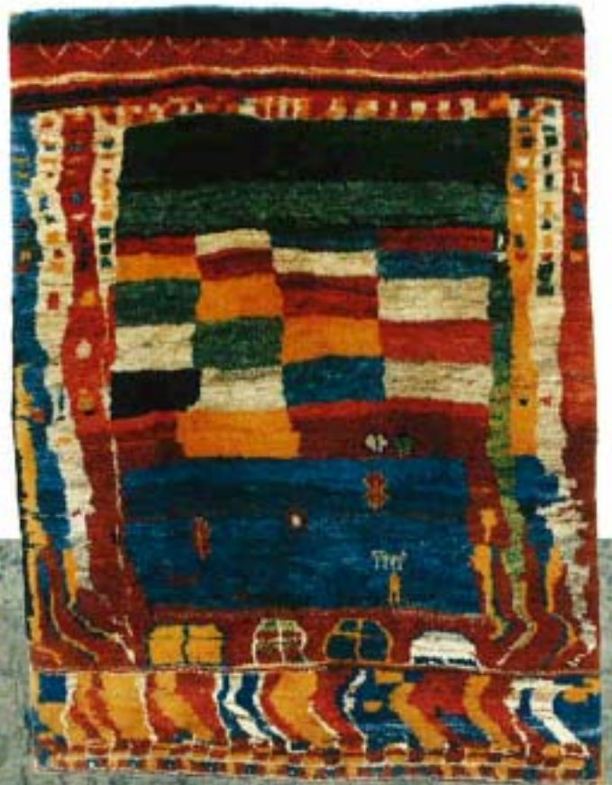
12006 graffiti, 130x113 cm.