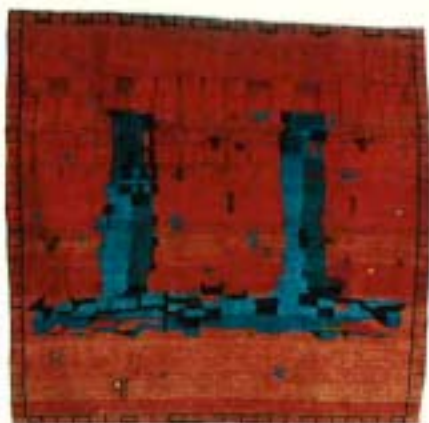
grafiti®, 198x210 cm, Fr. 4600.-. Zannetos AG, Silbergasse 6, 2502 Biel/Bienne, Tel. 032/22 08 54.