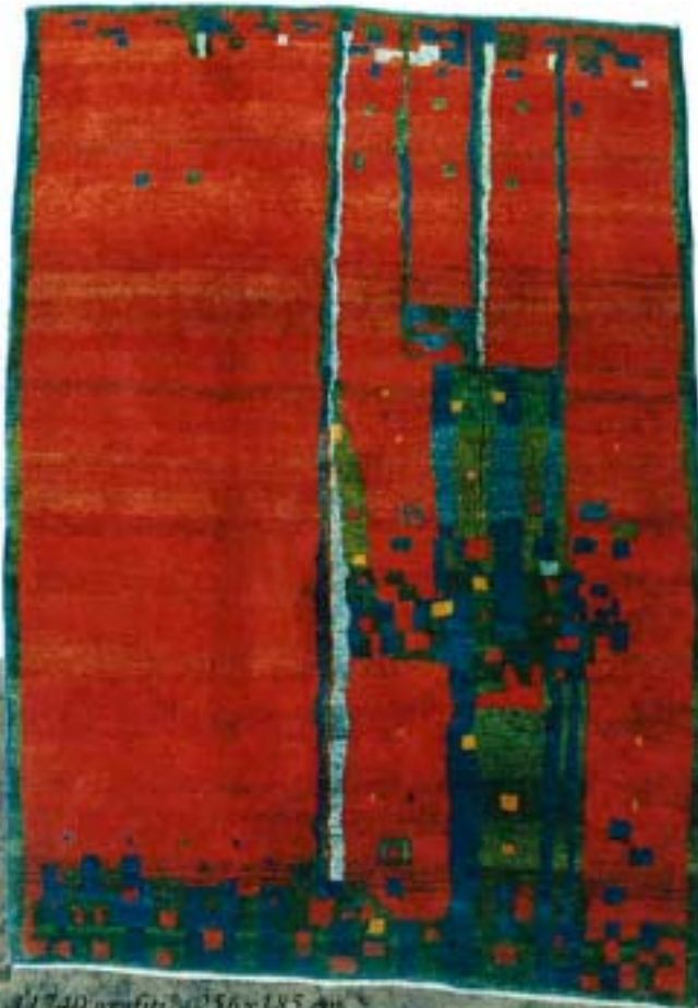
11740 graffiti, 256x185 cm.