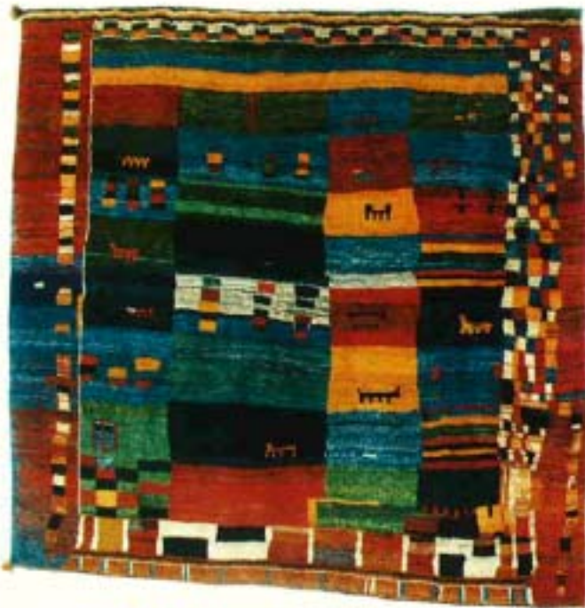
grafiti®, 204x207 cm, Fr. 4680.-. Zannetos AG, Silbergasse 6, 2502 Biel/Bienne, Tel. 032/22 08 54.