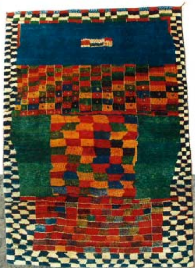
12168 grafiti o , 238x173 cm