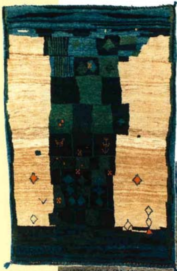
11736 graffiti - 183 x 120 cm.