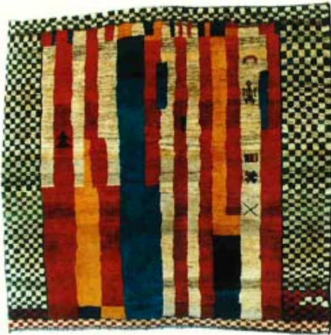
grafiti®, 198x206 cm, Fr. 4520.-. Teppichhaus im Schössli, Oscar Huber, Speisergasse 42, 9000 St. Gallen, Tel. 071/22 37 22.