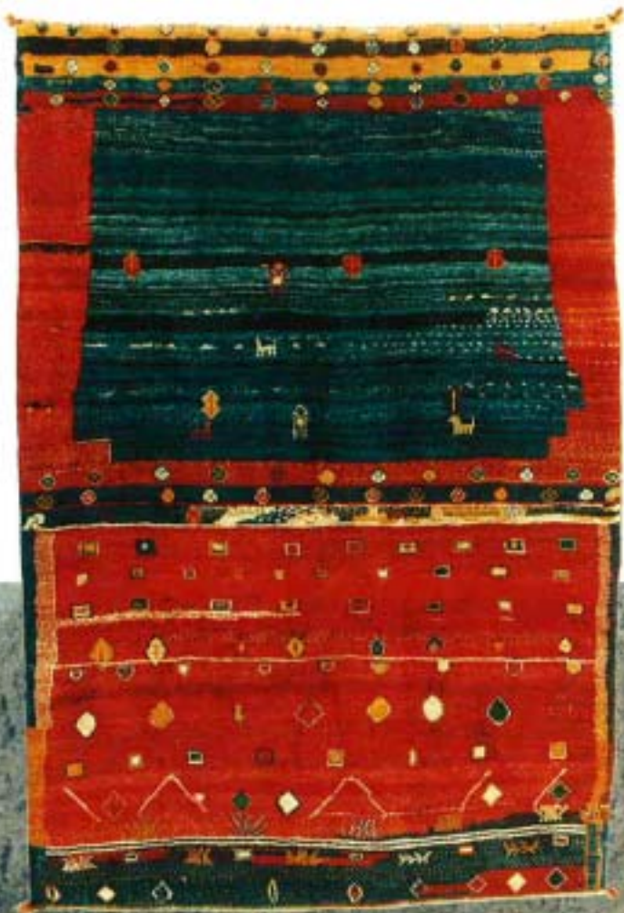
11673 grafiti o , 267x179 cm