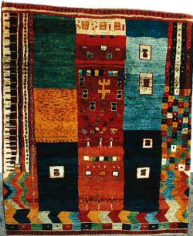
11752 grafiti ® ; 193x161 cm.