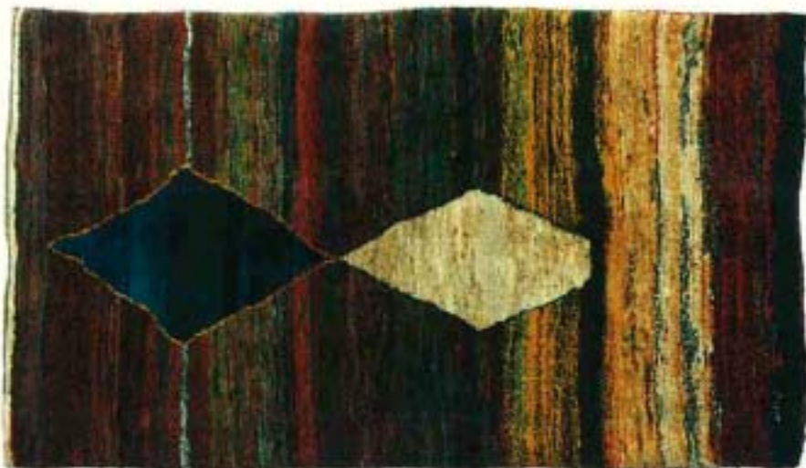
grafiti®, 195x115 cm, Fr. 2490.-. Linsi + Co AG, Zentralstrasse 2, 6002 Luzern, Tel. 041/211 00 55.