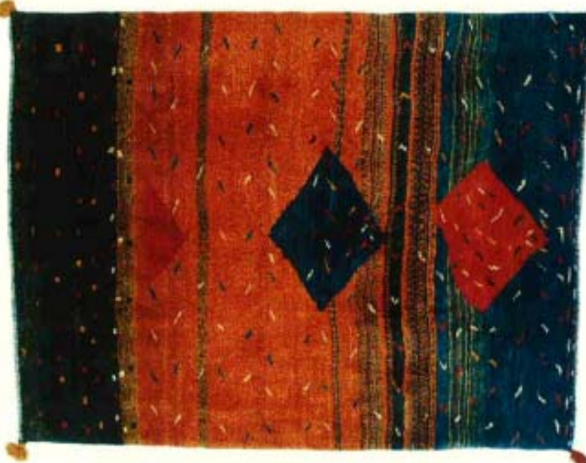
grafiti®, 230x179 cm, Fr. 4570.-. Galerie Kistler, Dekor Ki AG, Bernstrasse 11, 3250 Lyss, Tel. 032/84 44 33.