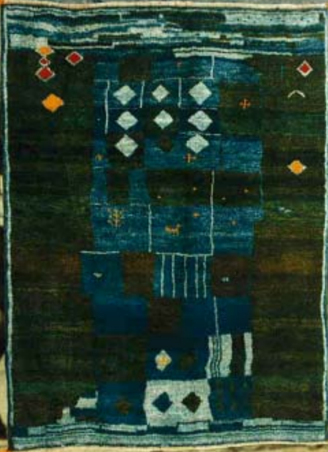
12032 graffiti, 194x146 cm.