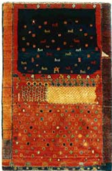
grafiti®, 190x123 cm, Fr. 2590.-. E. Gans-Ruedin SA, Grand-Rue 2, 2001 Neuchâtel, Tel. 038/25 36 23.