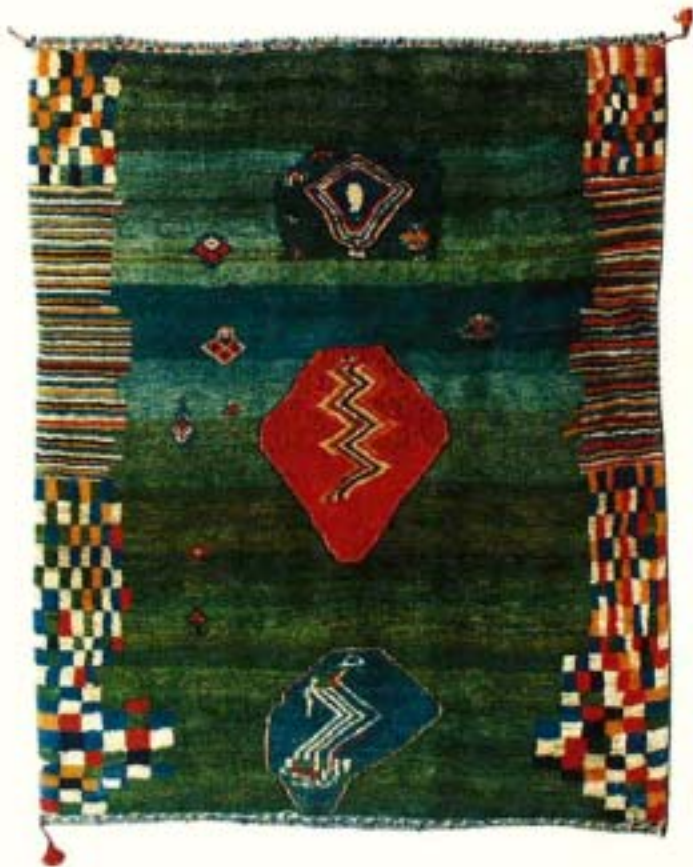
grafiti®, 197x157 cm, Fr. 3430.-. Teppich Stettler AG, Amthausgasse 1, 3011 Bern, Tel 031/312 03 33.