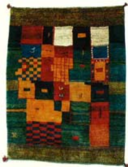
grafiti®, 206x160 cm, Fr. 3650.-. Wirz-Teppiche, Kramgasse 10, 3000 Bern 8, Tel 031/311 20 03.