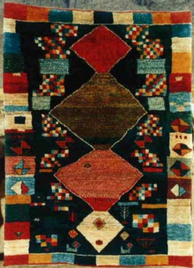
11762 grafiti ® ; 165x122 cm.