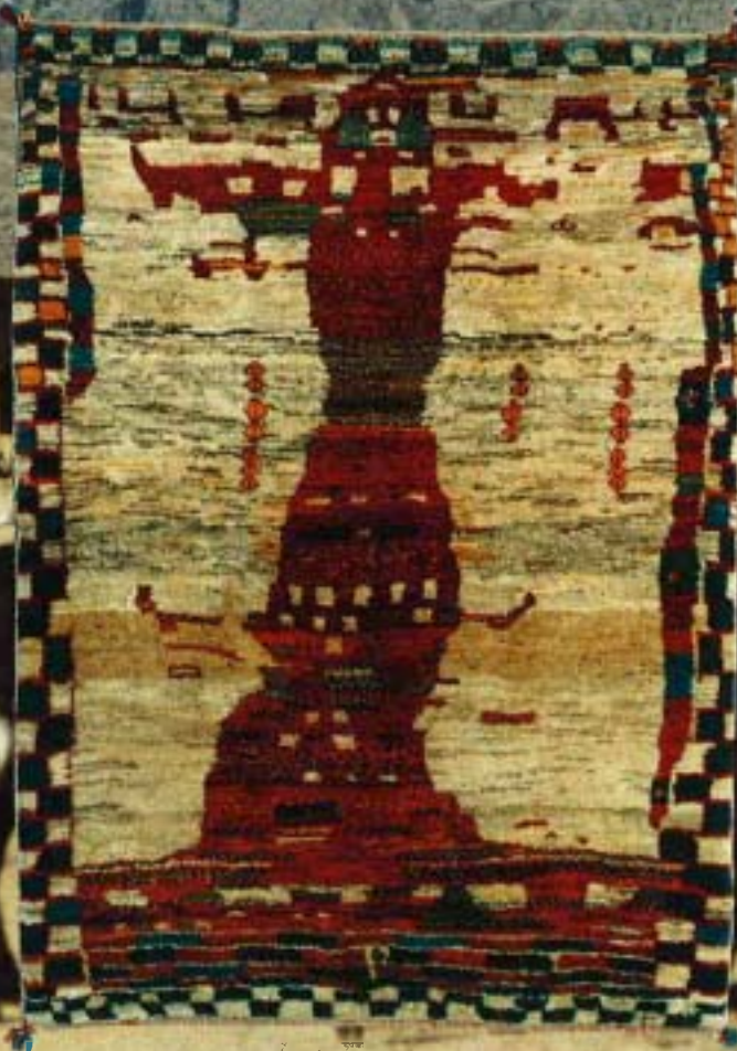
12022 grafiti ® ; 160x120 cm.